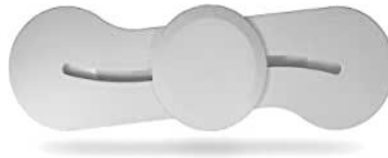
ロング (自動車用) TAISコード 02030-000002