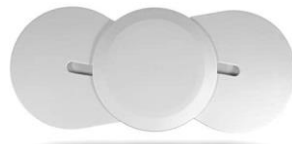
ショート (トイレ用) TAISコード 02030-000003

ビージーボードをご購入いただきまして有難う御座います。 本製品を安全かつ確実にご使用いただき、本製品の機能を十分にご活用いただきたくため、ご試用前にこの取扱説明書を必ず良く読み、内容をご理解いただいた上でご使用ください。本説明書は大切に保管してください。