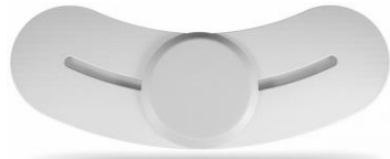
スタンダード (汎用) TAISコード 02030-000001