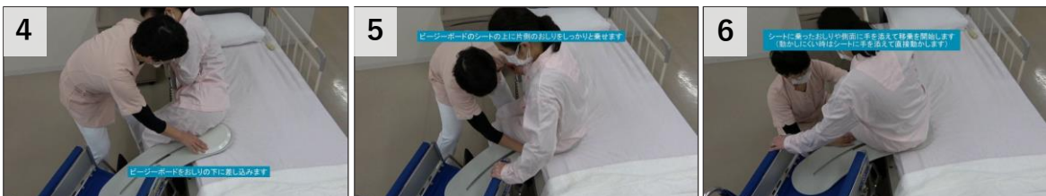
4 ビージーボードをおしりの下に差し込みます(2)