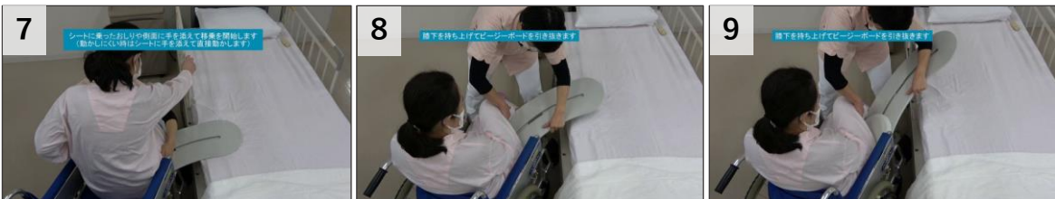
7 シートに乗ったおしりや側面に手を添えて移乗を開始します(動かしにくい時はシートに手を添えて直接動かします)